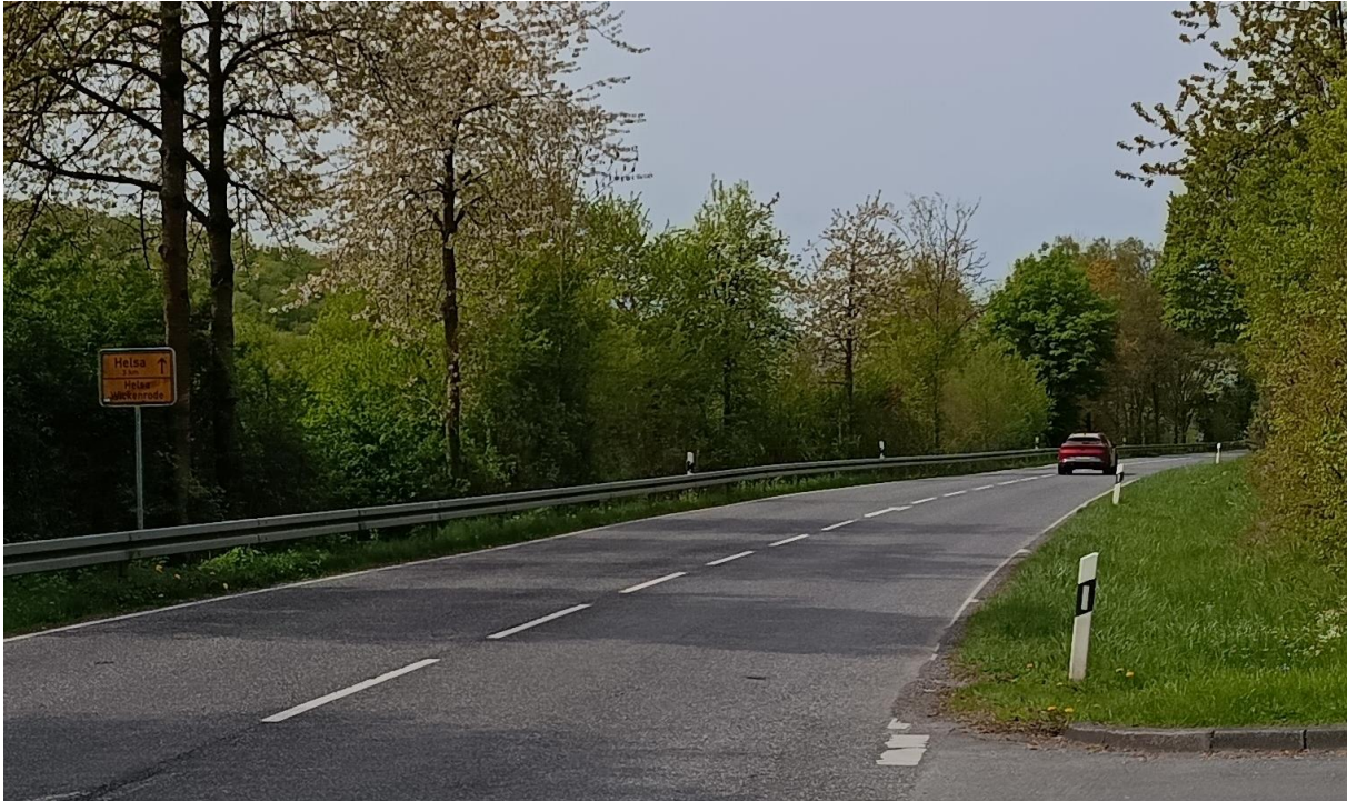
Abbildung 3: Ortsausgang von Wickenrode ohne Straßensperrung

Der GEW Kreisvorstand erwartet von Hessen Mobil, dass am 26.05.2026 keine fertigen Fakten präsentiert werden, sondern eine echte fachliche Auseinandersetzung über die nun belegten 8m Fahrbahnbreite erfolgt. „Eine Sperrung der B451 zwischen Helsa und Wickenrode ist für eine wie auch immer gearbete Fahrbahnerüchtigung nach unseren Messungen weder verhältnismäßig noch alternativlos“ , so Maydorn.