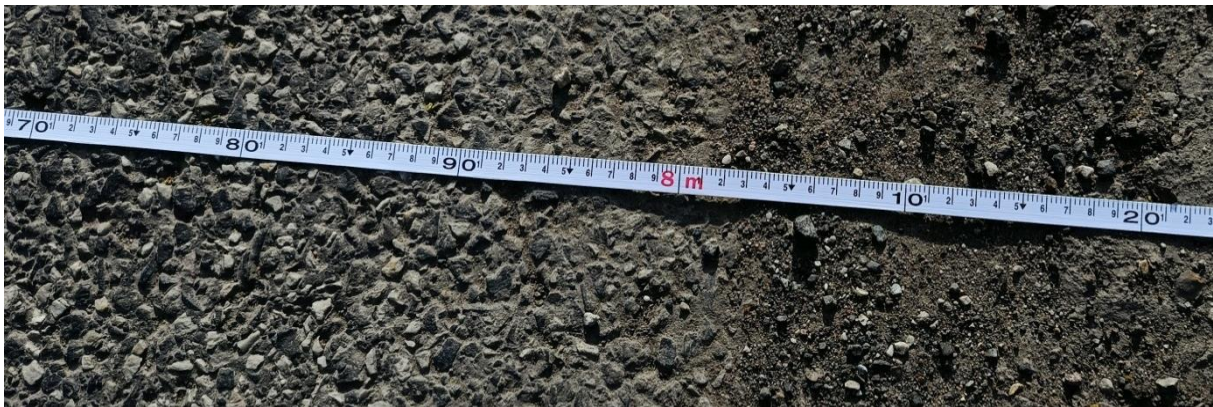
Abbildung 1: Messung der Fahrbahnbreite

Hessen Mobil begründet die Notwendigkeit einer Vollsperrung bisher mit einer angeblichen Fahrbahnbreite von lediglich 6,00 Metern. Nach Angaben der Behörde reiche dieser Platz nicht aus, um gleichzeitig Bauarbeiten durchzuführen und den Verkehr einspurig per Ampel vorbeizuführen, ohne den Arbeitsschutz zu gefährden.